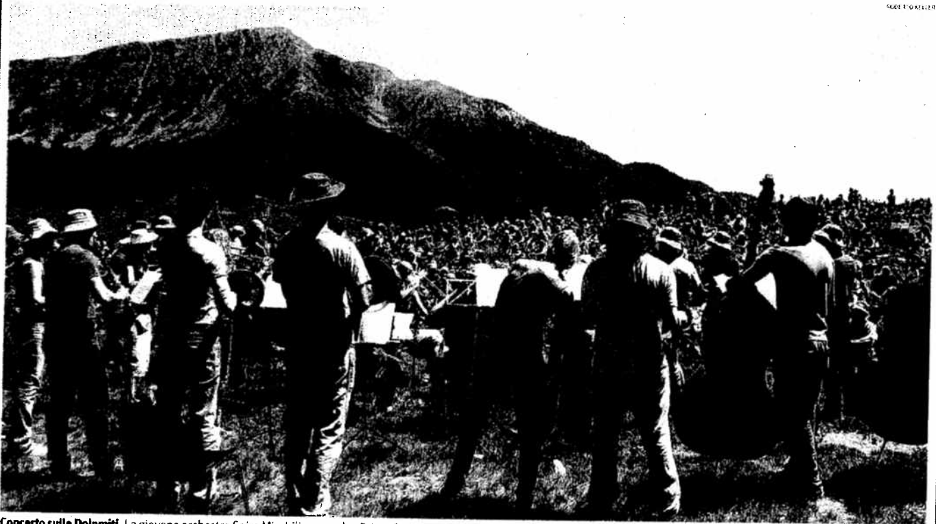
Concerto sulle Dolomiti. La giovane orchestra Spira Mirabilis suona la «Prima Serenata» di Brahms al Passo Lavazé